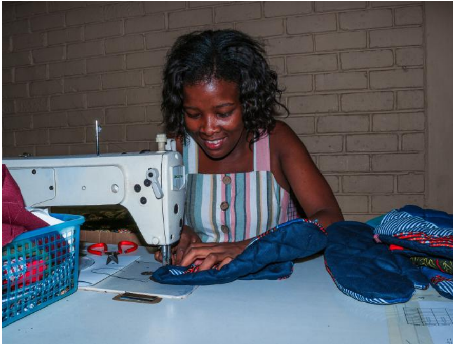
Productie van ovenhandschoenen voor Nederlandse opdrachtgever