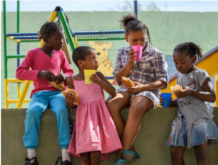
Gezonde tussentijdse snacks